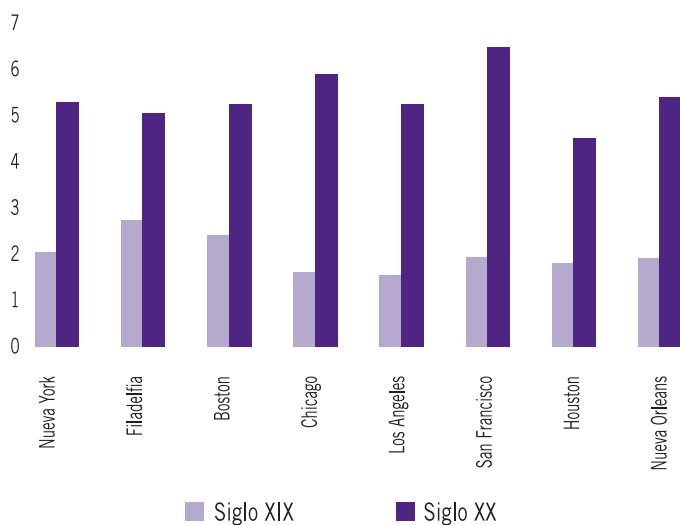
Gráfica 8.2. Duración de los periodos de autoridades municipales en Estados Unidos (años)

Considera solamente las reelecciones consecutivas.