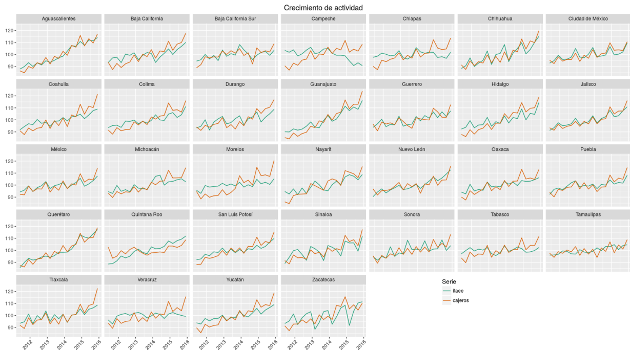
Figura 3: Crecimiento de actividad