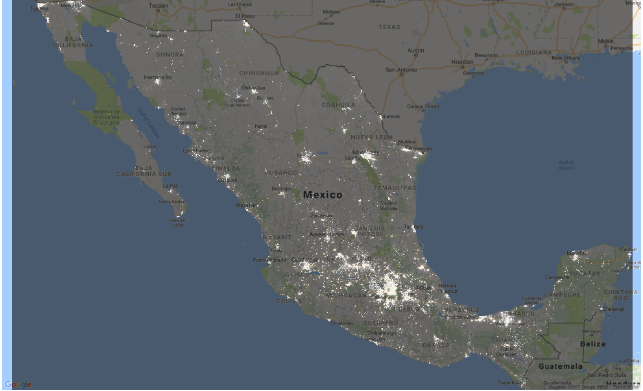
Figura 1: Foto satelital

información. Por ejemplo, la presencia de nubes en alguna región obstruye la luz cuando se toma la foto satelital y la haría parecer menos luminosa. Los archivos comprenden periodos de un mes, de donde se puede distinguir cuáles de las zonas fueron distorsionadas por nubes y remover dicho efecto.