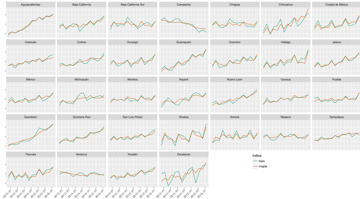
Figura 4: Comparación estados