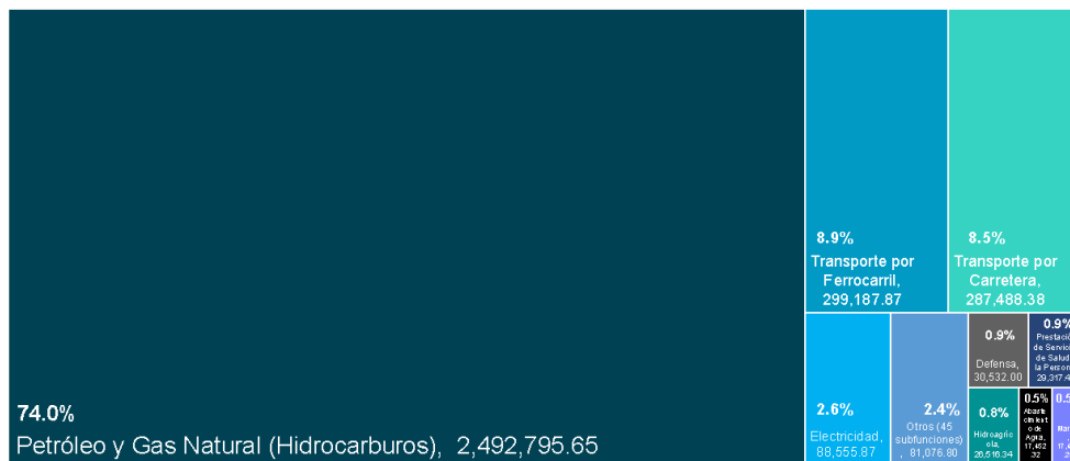
Gasto federal en obra pública por subfunción entre 2015 y 2022 (millones de pesos de 2023)

Nota: Deflactor basado en el INPC y expectativas de inflación de los Criterios Generales de Política Económica 2023.