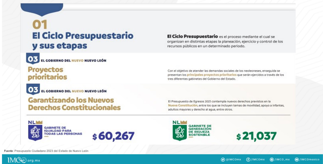
Figura 2. Buenas Prácticas del Estado de Nuevo León

La institucionalización de buenas prácticas en los Presupuestos Ciudadanos es necesaria para que el potencial de estos instrumentos no se desaproveche. Que la ciudadanía comprenda las finanzas públicas de su estado fomenta la rendición de cuentas .