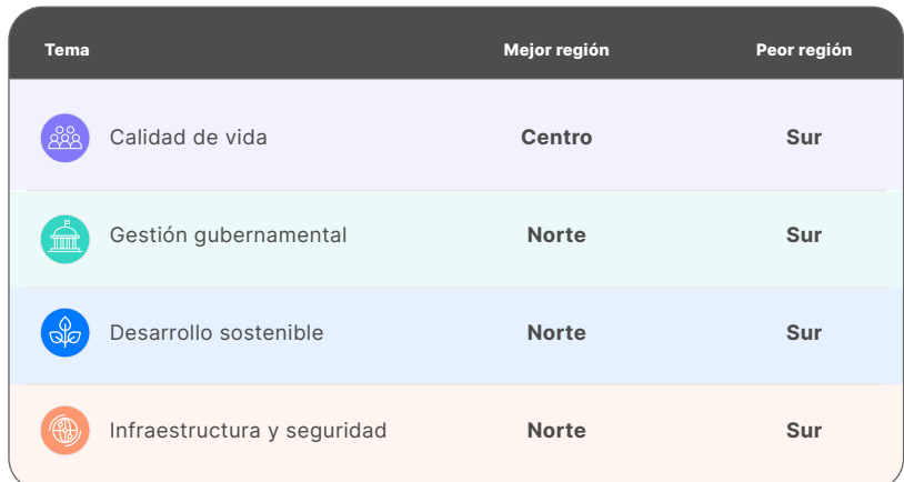
Tabla 1. Regiones con mejores y peores resultados por tema