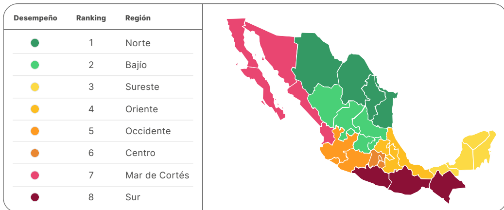
Tabla 2.1 Resultados de los indicadores considerados en el tema de Gestión gubernamental