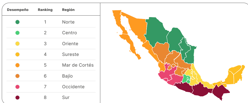
Tabla 4.1 Resultados de los indicadores considerados en el tema de Infraestructura y seguridad .