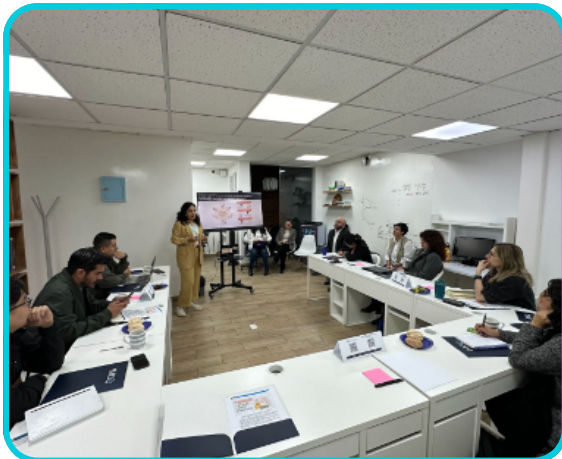
Eventos: Decididas 2024, 50 años DESEC, Taller de medios IMCO sobre Nearshoring e Impact Minds .