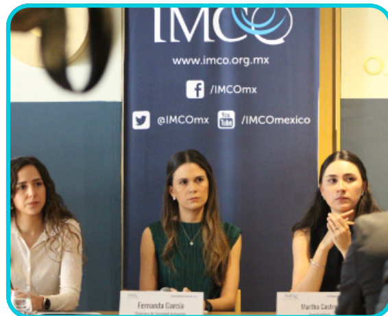
Eventos: Índice de Brecha de Género, Foro 10 por la Educación, Foro Mujeres en la economía en el Senado y Compara Carreras 2024.