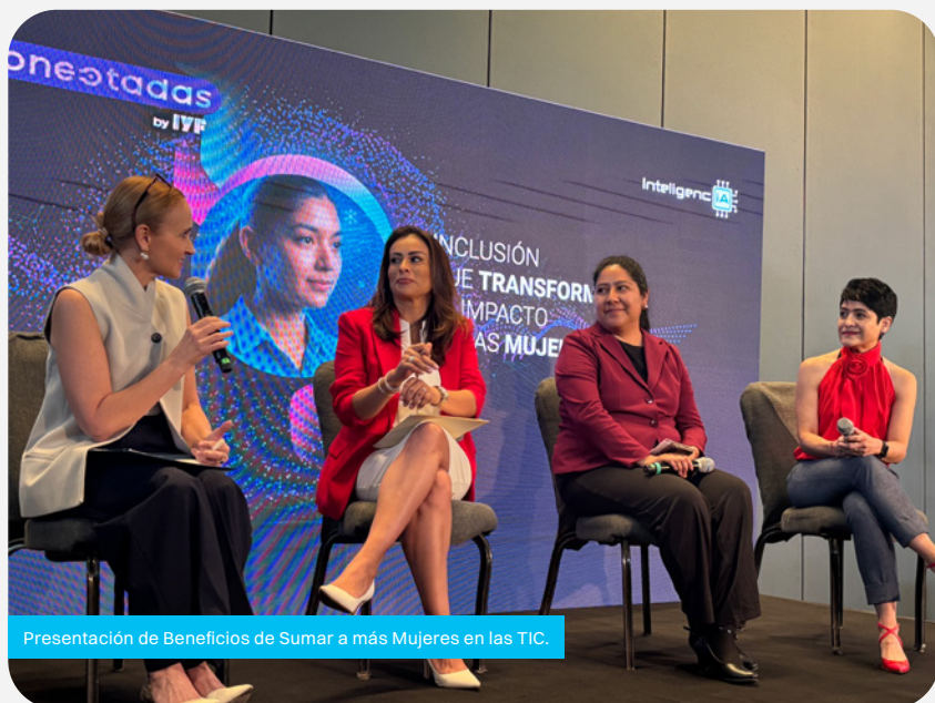
Presentación de Beneficios de Sumar a más Mujeres en las TIC.