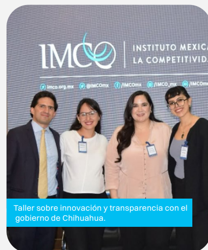
Taller sobre innovación y transparencia con el gobierno de Chihuahua.