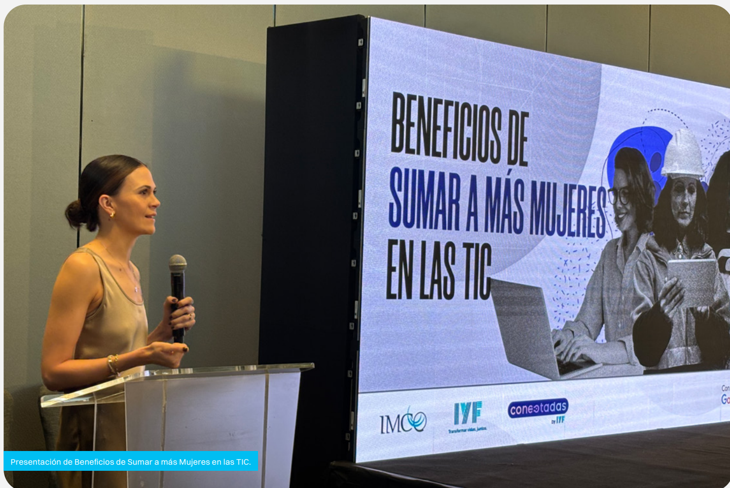
Presentación de Beneficios de Sumar a más Mujeres en las TIC.