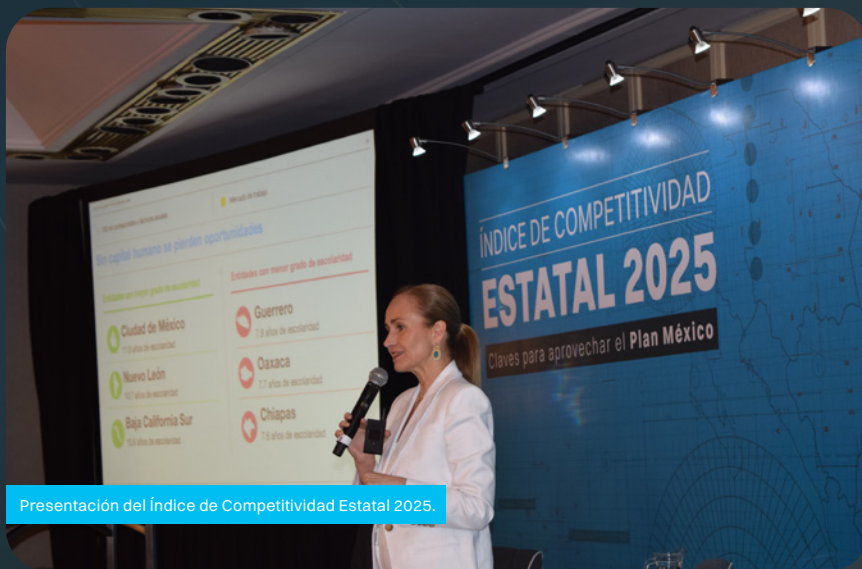
Presentación del Índice de Competitividad Estatal 2025.